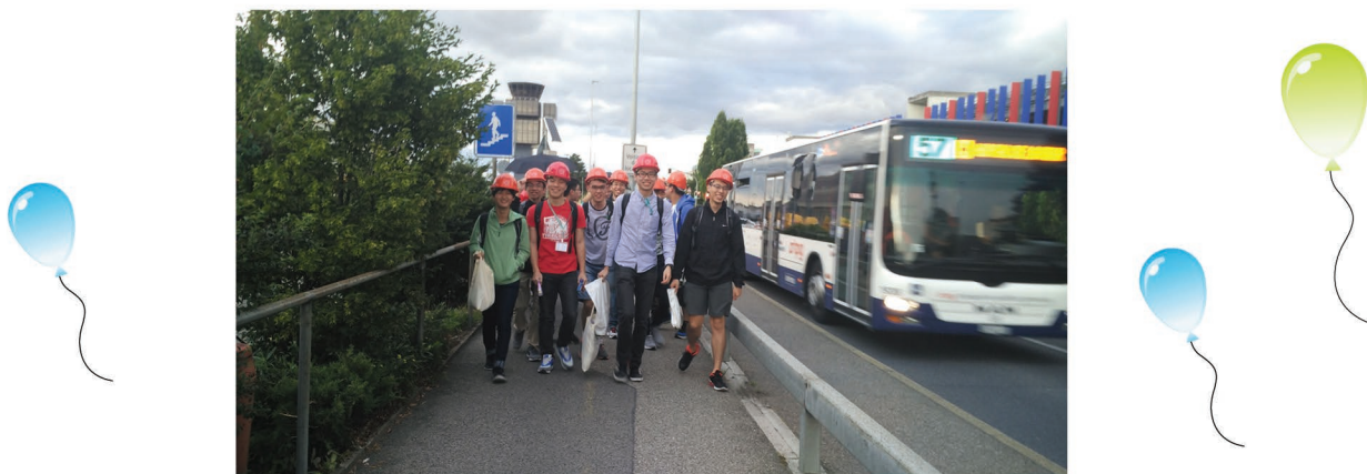
甚麼是中大精神？這張照片正好不言而喻。中學生與大學生共同探索科學！

“在這個遊學團中最難忘的是跟駐守在歐洲核子研究中心的香港科學家及學生作交流。未參與這次活動之前，我一直認為科學研究距離我很遠，雖然在課堂上學到不少書本上的知識，但一直不知道如何將知識應用到研究上。在跟香港科學家接觸後，我得知香港有不少科學家亦有參與這全球最大型的科學研究，更有不少本科生同學會到當地參與研究和學習高能粒子物理，使我知道本地大學其實亦有很多機會參與前線的科學研究。在跟科學家交流後，我明白到他們不但要一面學習一面做研究工作，更加要和世界不同地方的人去合作和溝通，為的是達成同樣的實驗目標，這令我深深感受到科學家的熱誠，使我得到了啟發。”